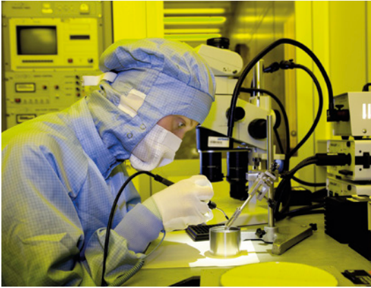
Montage von Laserstacks am Ferdinand-Braun-Institut